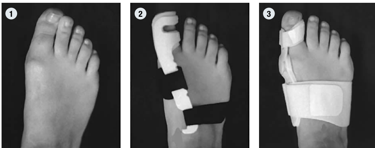
Fig. 1 – 3:

(1) Patient, 23 ans, avec Hallux valgus et bursite douloureuse, (2) correction par attelle de nuit rigide et (3) par nouvelle orthèse dynamique.