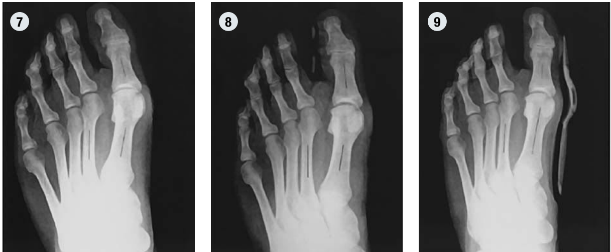
Fig. 7 – 9:

(4) Patient, 39 ans, avec un angle d'Hallux valgus de 40°, (5) correction par attelle de nuit rigide à 20° et (6) par orthèse dynamique à 18° normalisation de l'angle intermétatarsien ( \beta ) à 8° avec l'orthèse dynamique Hallufix®.