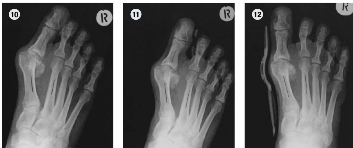
Fig. 10 – 12:

(10) Patient, 58 ans, avec un angle d'Hallux valgus de 46°, (11) correction par attelle de nuit rigide à 30° et (12) par orthèse dynamique Hallufix® à 16°.