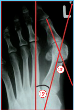
Hallux Valgus sans l'orthèse Hallufix® Angle intermétatarsien: 16° Angle de déformation: 40°

en cas d'oignon douloureux et de déviation du gros orteil